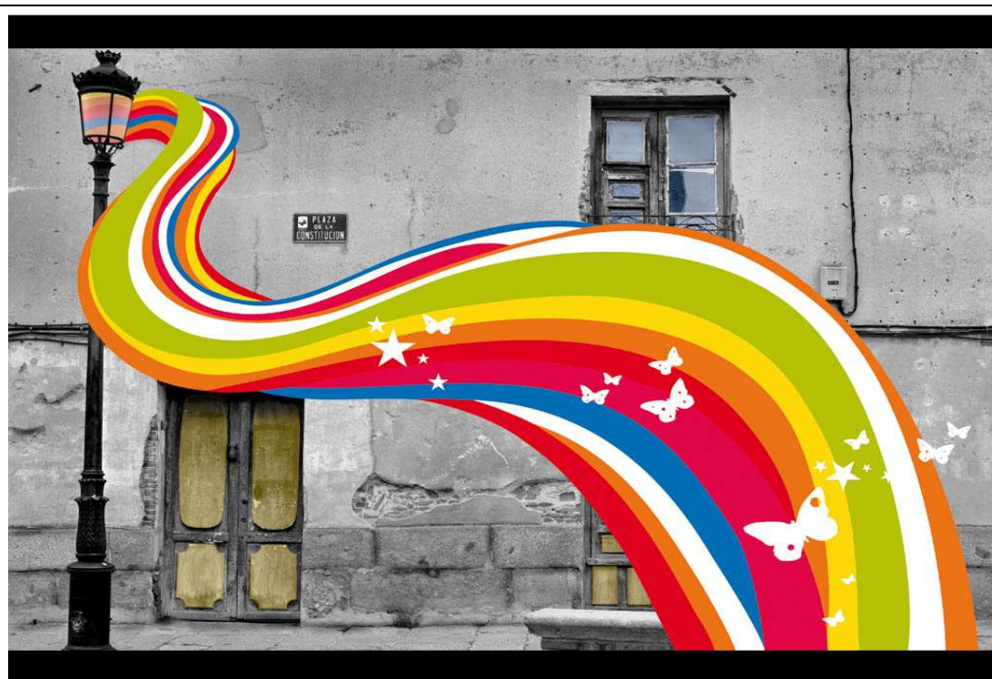
Ha sido realizada dentro del proyecto 10x10, fruto de la colaboración del CITA con el Ayto. de Peñaranda de Bracamonte y con varios artistas de esta localidad. Los autores son D. Enrique Carrascal y D. a Tatiana Martins .