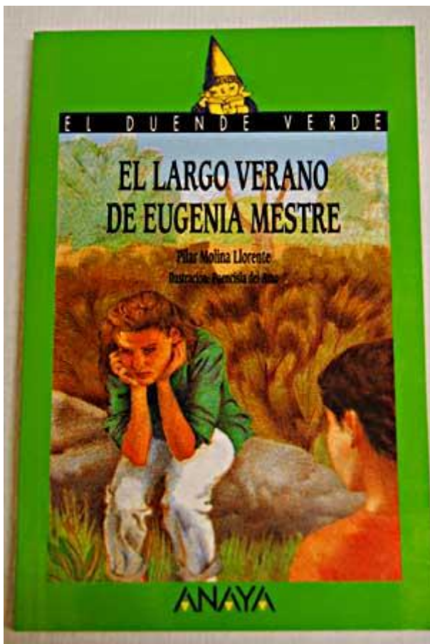
Imagen extraída de la siguiente página web:

Los alumnos de 5º curso leerán el libro titulado El largo verano de Eugenia Mestre ; y los alumnos de 6º curso leerán el libro Navidad. El regreso de Eugenia Mestre (se supone que los alumnos de 6º han leído cuando iban a 5º el libro anterior).