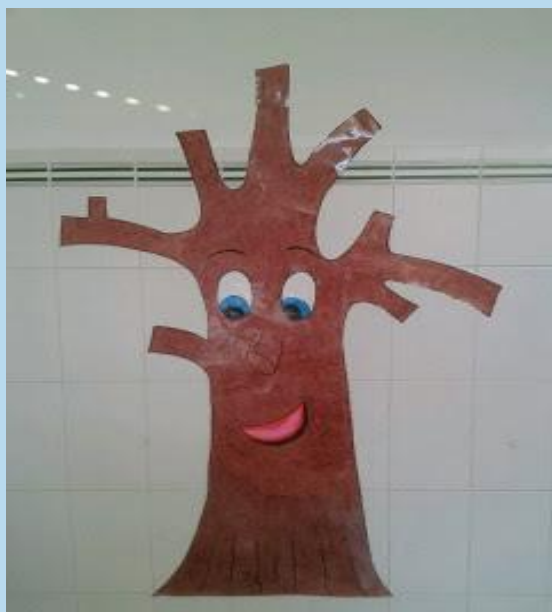
Imagen extraída de: