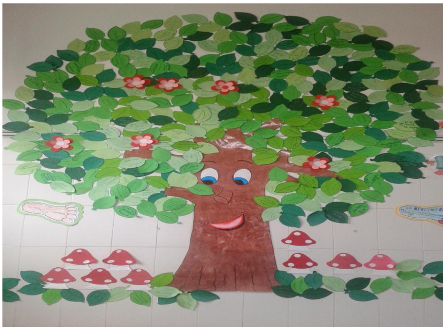
Animación a la lectura. Biblioteca Escolar C.E.I.P. Nueva Nerja

Por cada libro leído, se le dará al alumno/a una hoja como éstas de abajo, que pegará en el árbol con el título del libro leído, autor y el nombre del niño o niña.