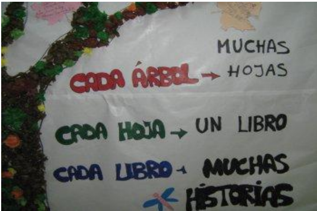
El árbol de la lectura CEIP. San Isidro Labrador

Por cada libro leído, se le dará al alumno/a una hoja como éstas de abajo, que pegará en el árbol con el título del libro leído, autor y el nombre del niño o niña.