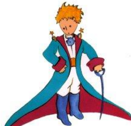
Aquí tienen el mejor retrato que más tarde logré hacer de él

Me puse en pie de un salto como herido por el rayo. Me froté los ojos. Miré a mi alrededor. Vi a un extraordinario muchachito que me miraba gravemente. Ahí tienen el mejor retrato que más tarde logré hacer de él, aunque mi dibujo, ciertamente es menos encantador que el modelo. Pero no es mía la culpa. Las personas mayores me desanimaron de mi carrera de pintor a la edad de seis años y no había aprendido a dibujar otra cosa que boas cerradas y boas abiertas.