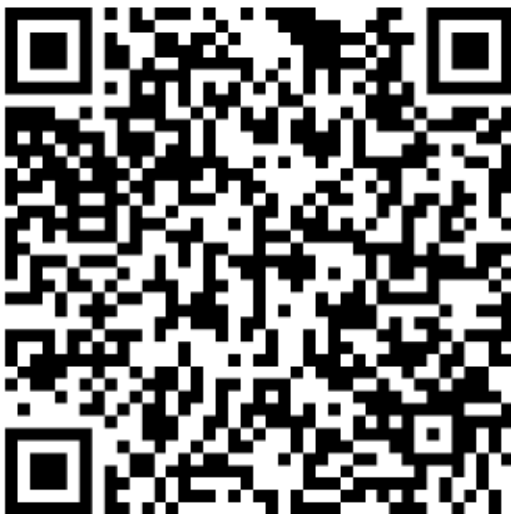
Lectura palabras 5