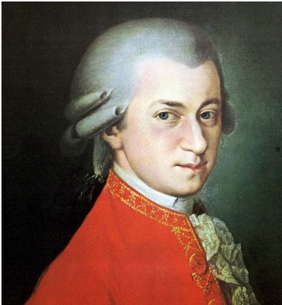
Imagen de Mozart

• Papel de la música en la alta burguesía y de esta en la vida de los compositores. En la ilustración 2, que representa una cantante entrando en el palacio, se muestra la realidad de la época: en el clasicismo los músicos escribían la mayor parte de sus obras para la sociedad burguesa y eran interpretadas muy frecuentemente en los palacios que eran de su propiedad.