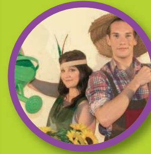
"A day on the farm" Cía FORUM TEATRO, dirigida a 1 er Ciclo de Primaria (1 o y 2 o de Primaria).