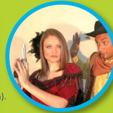
"The far west" Cía FORUM TEATRO, dirigida a 2 o y 3 er Ciclo de Primaria (3 o , 4 o , 5 o y 6 de Primaria).