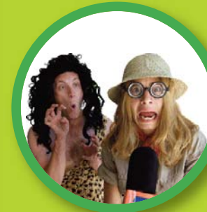
"Tarzan" Cía FACE 2 FACE, dirigida a Primaria (1 o , 2 o , 3 o , 4 o , 5 o y 6 o de Primaria).