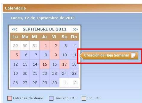
Ilustración 7: Botón de creación de Hoja Semanal.

Si el alumno está realizando más de un intervalo de FCT esa semana, se mostrará la siguiente página, donde el usuario podrá elegir para qué intervalo desea crear la Hoja de Seguimiento Semanal.