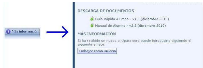
Ilustración 9: Más Información.

trabajar como alumno, esta opción le devuelve a la página principal del usuario, donde podrá asociarse a otras entidades o introducir un nuevo pin/pinpassword.