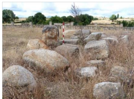
Vestigios rescatados del cauce del Águeda. Residencia de ancianos.