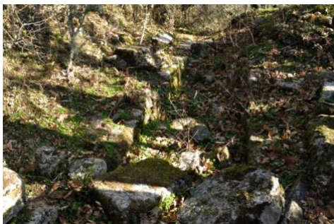
Área de “la calle” (5). Probablemente, una canalización.