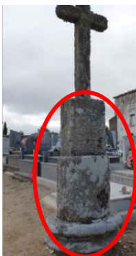
Materiales procedentes de Iruña reutilizados en diferentes construcciones en Fuenteguinaldo.