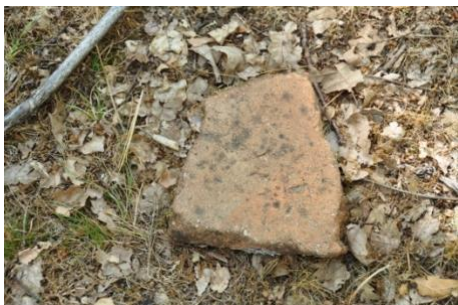
Restos de tégula.