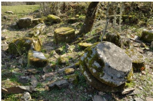
Zona de “el templo” o “el palacio” (4)

Vestigios arquitectónicos como restos de columnas, sillares, cornisas... todo ello de granito, piedra llevada a Iruña desde las canteras de Peñaparda o de Fuentes de Oñoro. También tégulas repartidas por todo el yacimiento.