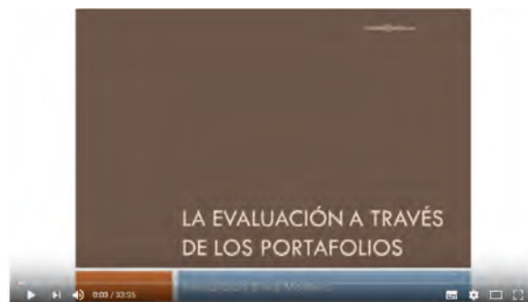
Inmaculada Báez Montero El portafolio y la evaluación