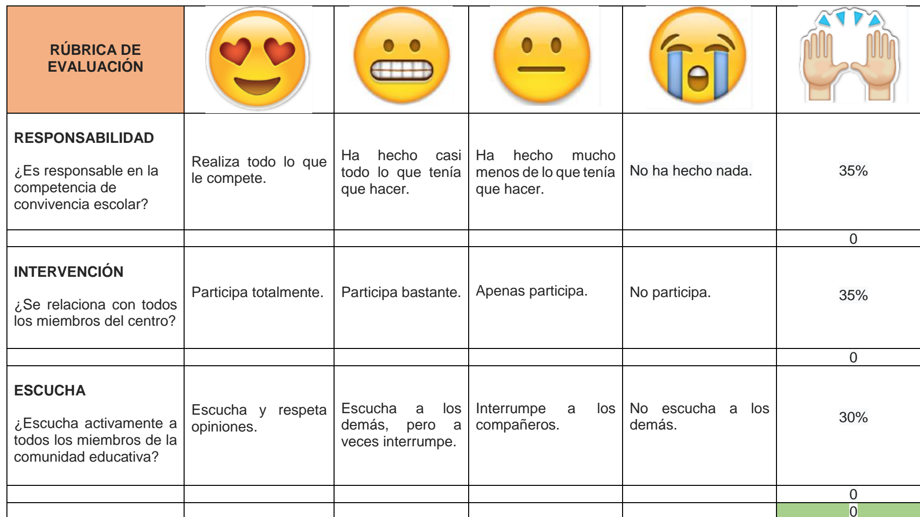
TABLA 1: RÚBRICA DE AUTOEVALUACIÓN