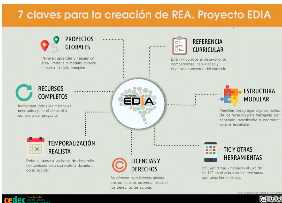
Cristina Valdera. 7 claves para la creación de REA (CC BY-SA)