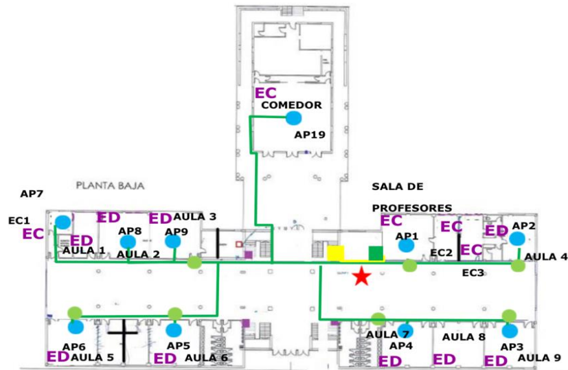
Vista en planta de la Planta Baja de la sede con la solución WIFI instalada en el centro