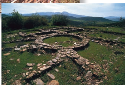
Castreín de San Juan de Paluezas.