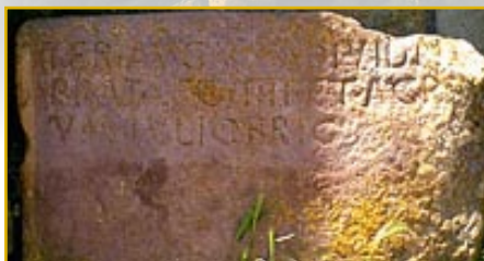
Hito terminal de la Legión IV Romana en Villasabariego, León

El pueblo de los astures tiene su origen en asentamientos en el N.O. de España durante la edad del Bronce. Su periodo de formación en los siglos VI y V a.C. es poco conocido. Se han realizado excavaciones en asentamientos astures anteriores a la conquista romana en el I a.C. pero la mayor parte de los datos que conocemos sobre ellos nos han llegado a través de escritores romanos, que los presentan como un pueblo bárbaro y poco civilizado.