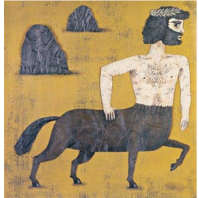
Il.: Jorge André Letria En: Animales fantásticos Ed.: Kalandraka Ediciones Andalucía

[2] Otra posible actividad, también por grupos, parte de elegir un mito (personaje, historia) de entre los muchos que protagonizan títulos infantiles. Por ejemplo: