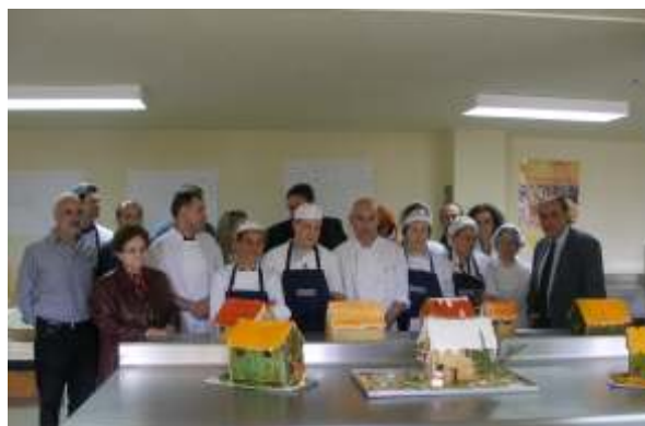
Alumnos del curso, profesores y representantes del CETECE y de la Junta de Castilla y León durante la clausura del curso. Como novedad, los alumnos prepararon con ilusión una exposición de casitas de galletas que habían elaborado durante las clases prácticas.