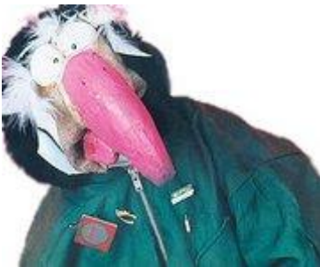
El pavo irlandés

Pero la letra del chicki chicki no puede ir tal cual como la ha compuesto Rodolfo chiquilicuatre si no que va ha tener que cambiar la letra de la canción por que habla de política y puede que ofenda a los demás políticos. Además la nueva canción del chicki chicki es bilingüe, ósea que es en dos idiomas ingles y español pero hay muy pocas palabras en inglés. La canción ira a eurovisión 2008 por que salio más votada en la pagina Web de RTVE, la gente este año ha pensado que después de que España nunca haya ganado nada. Hay muchas personas que opinan que el chicki chicki es una tontería, otras que les gusta y otras que no les gusta pero creen que puede quedar en los primeros puestos.