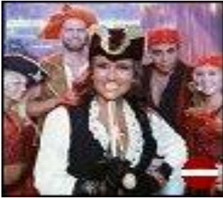
Los piratas lituanos

Los piratas lituanos involucran al capitán Garfio en un número de movimientos vistosos.