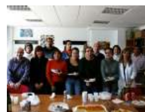
En la imagen superior, los alumnos durante una de las prácticas. Abajo, en el acto de clausura junto con las profesoras.