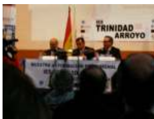
En la imagen de la izquierda un momento de la inauguración de la jornada. A la derecha, el Consejero de Educación durante su visita al stand del CETECE.

Entre las distintas actividades llevadas a cabo destacamos la exposición de materiales realizados por los alumnos de los distintos ciclos formativos y el desfile de "Mujeres de cine" celebrado durante la inauguración.