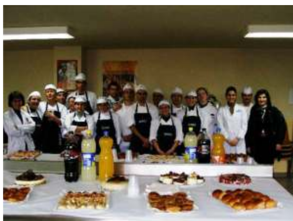
En la imagen superior alumnos del curso junto con el equipo docente.