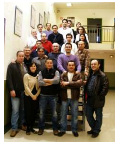
Grupo de asistentes del 2º curso impartido por CETECE