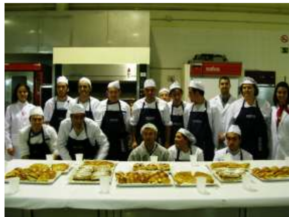
Los alumnos muestran orgullosos al equipo docente las elaboraciones realizadas.

Destacamos que en el momento de la redacción de este Boletín Informativo ya ha habido una oferta de trabajo para este colectivo.