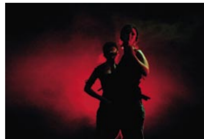
Formación de intérpretes