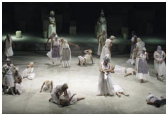
Formación de directores de escena