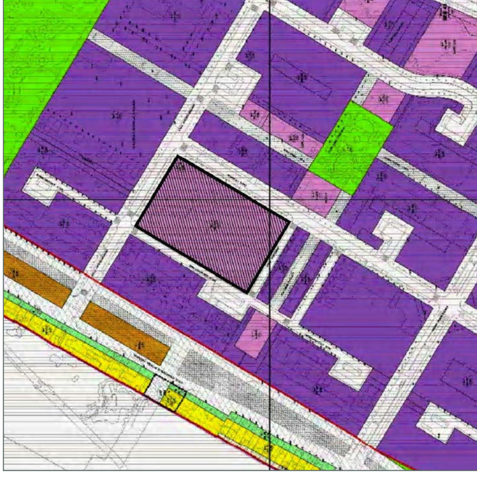
NORMATIVA URBANISTICA P.G.O.U.