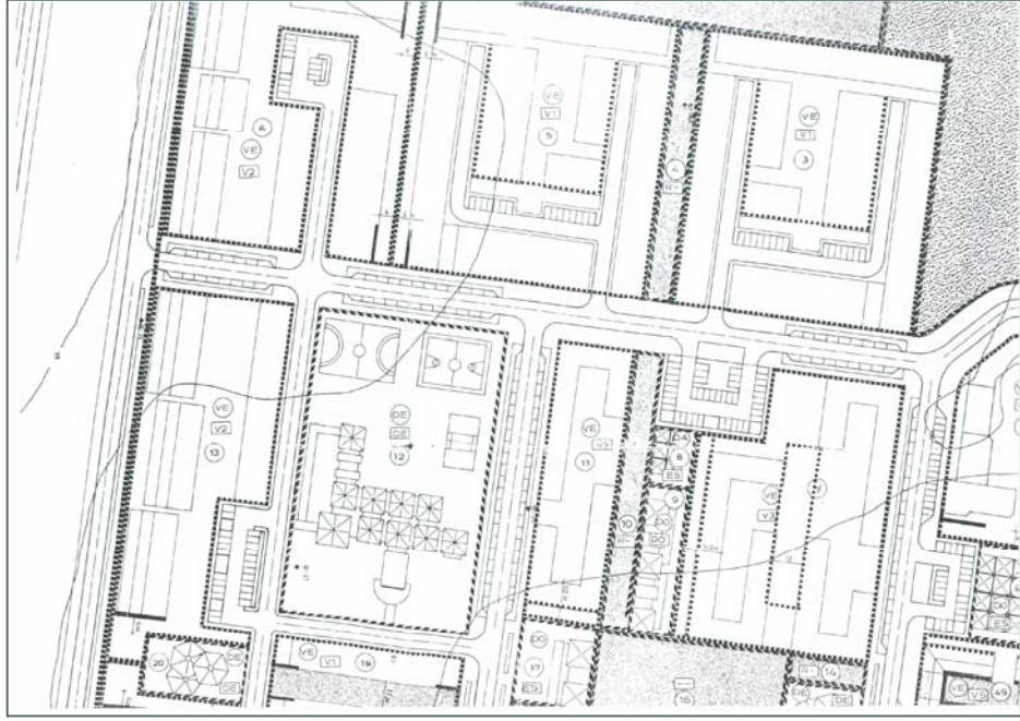
PLAN PARCIAL COVARESA