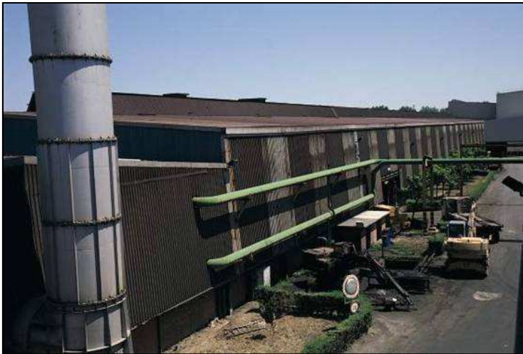
Planta siderúrgica de Sidor, en Vizcaya. (cerrada a raíz de la crisis industrial)

Ejercicio Práctico. A partir de la información proporcionada en los siguientes documentos, explicar las consecuencias de la crisis industrial en España.