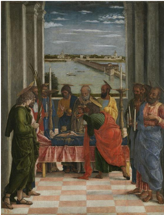
El Tránsito de la Virgen. Hacia 1462 Museo del Prado. Madrid