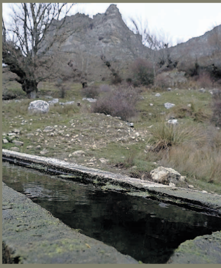
▼ Las Escoladeras y, al fondo, la Peña Amaya.