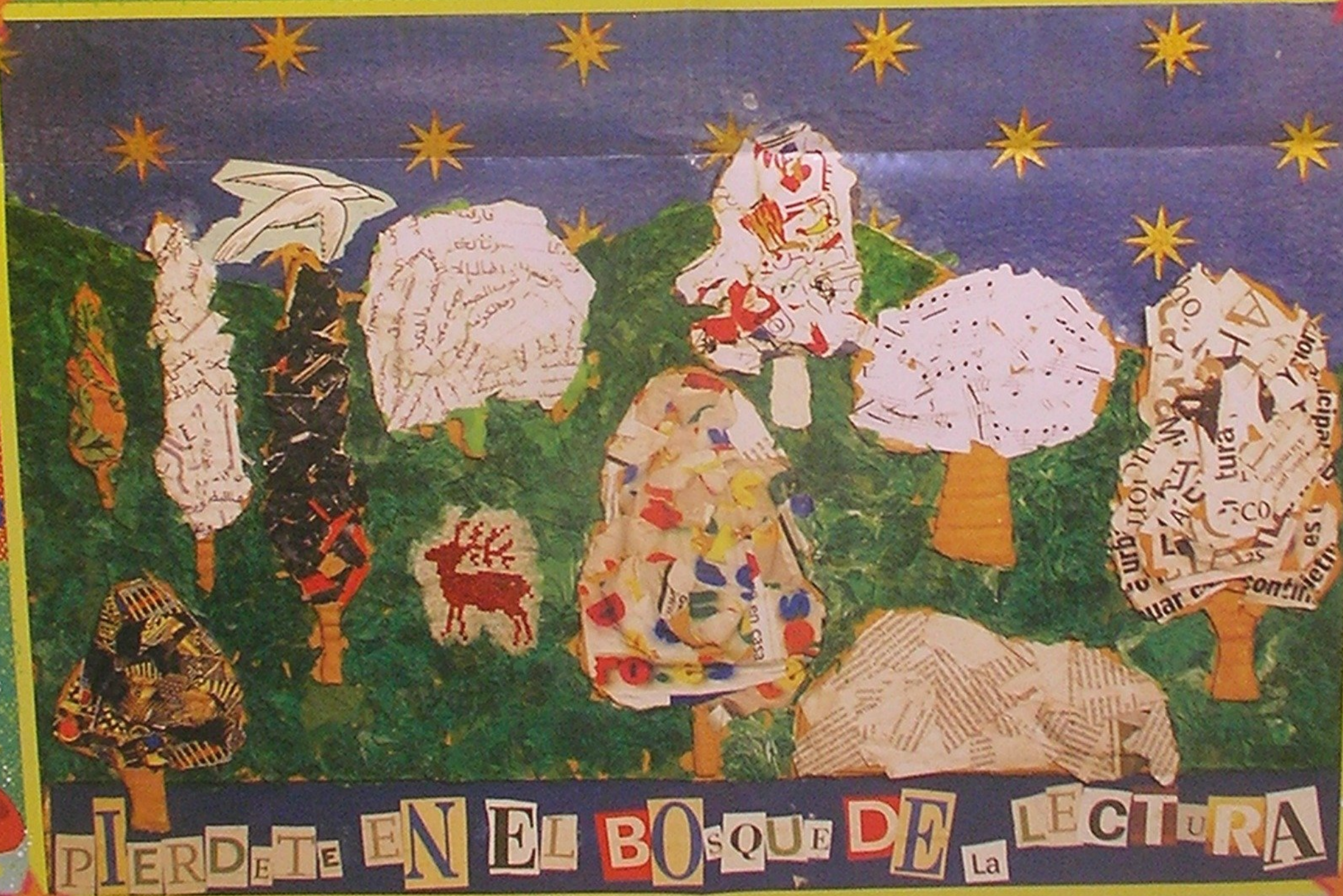
• Cartel realizado por: Miguel López Quindós, 6º de EPO, CEIP Los Angeles •