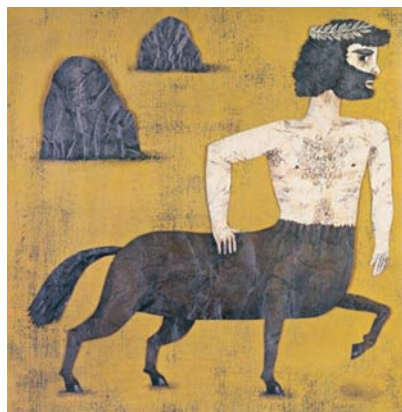
Il.: Jorge André Letria En: Animales fantásticos Ed.: Kalandraka Ediciones Andalucía

[2] Otra posible actividad, también por grupos, parte de elegir un mito (personaje, historia) de entre los muchos que protagonizan títulos infantiles. Por ejemplo: