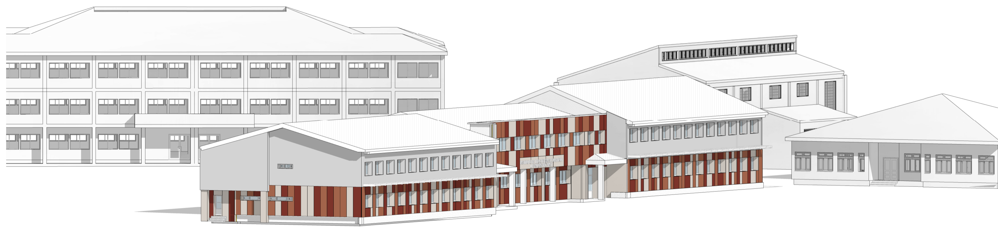
Vista Alzados A-B