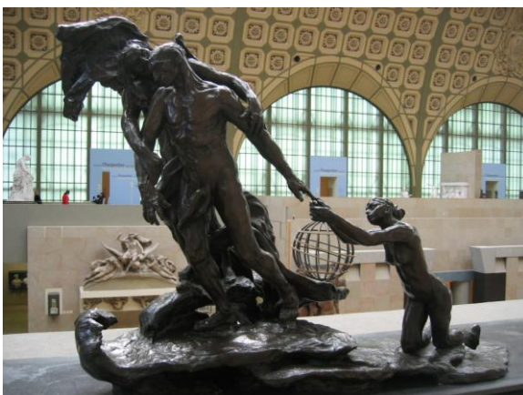
La madurez (1899-1913). Musée D' Orsay. París. Camille Claudel

Palabras de Camille escritas a su hermano Paul desde el asilo de Montdevergues: "... no quede yo para siempre en esta nada con barrotes que es la prisión de locos, donde mi madre y todos ustedes me han confinado, por haber tratado de ser Camille y mujer, Camille y artista, Camille y amante y libre" .