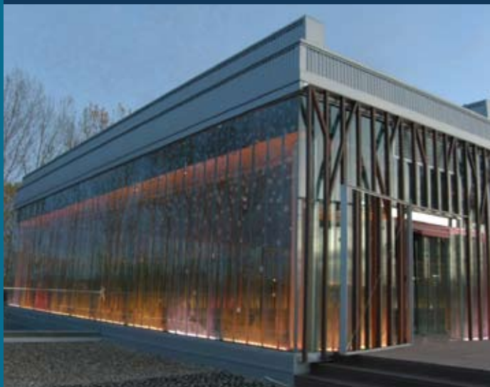
Edificio PRAE Valladolid