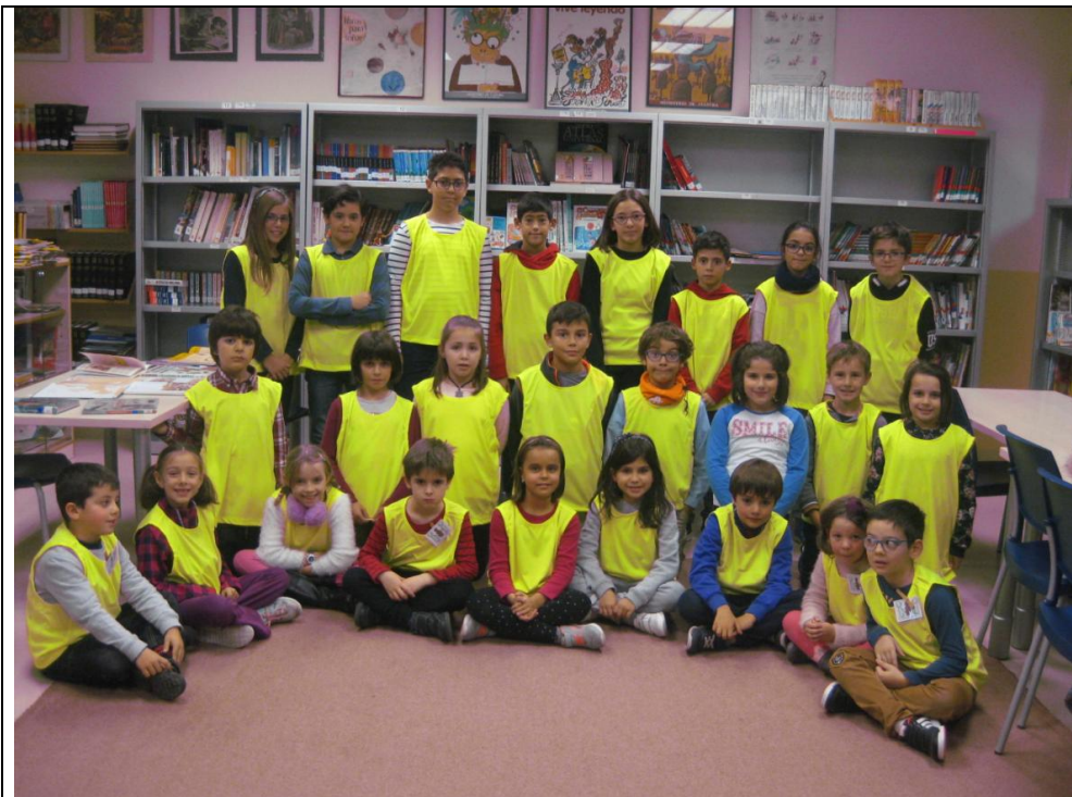
NUESTROS MEDIADORES Y AYUDANTES DE PATIO CON SU PETO RECIÉN ESTRENADO