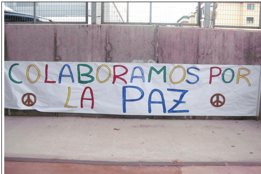
Día de la no violencia y la paz: celebrada el 30 de Enero.