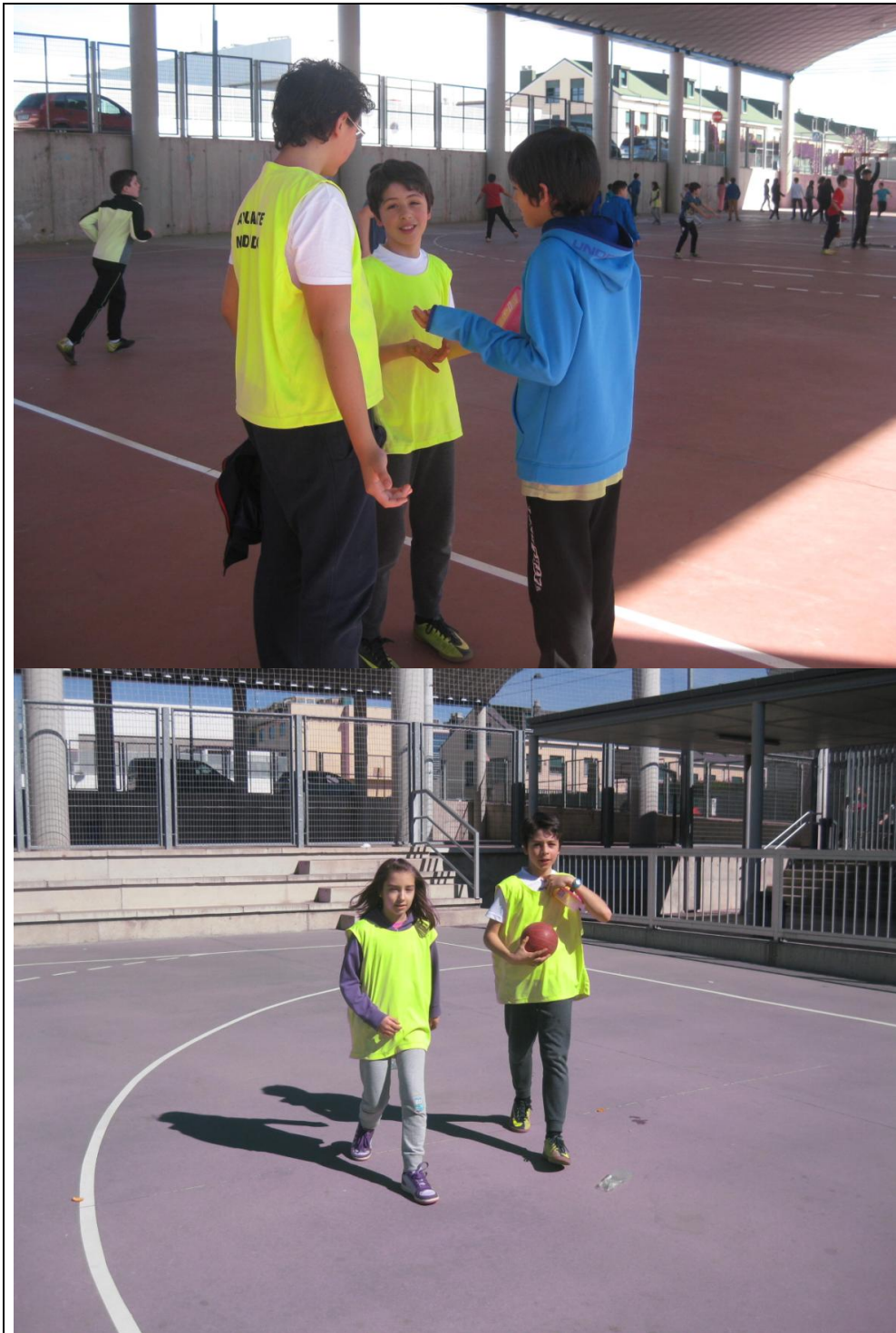
Los mediadores en acción.