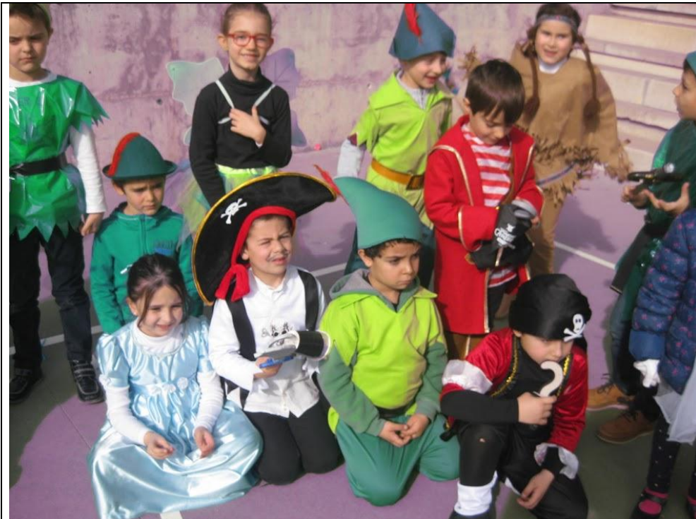
El día de carnaval , celebrado el 24 de febrero con el "cine" de tema.