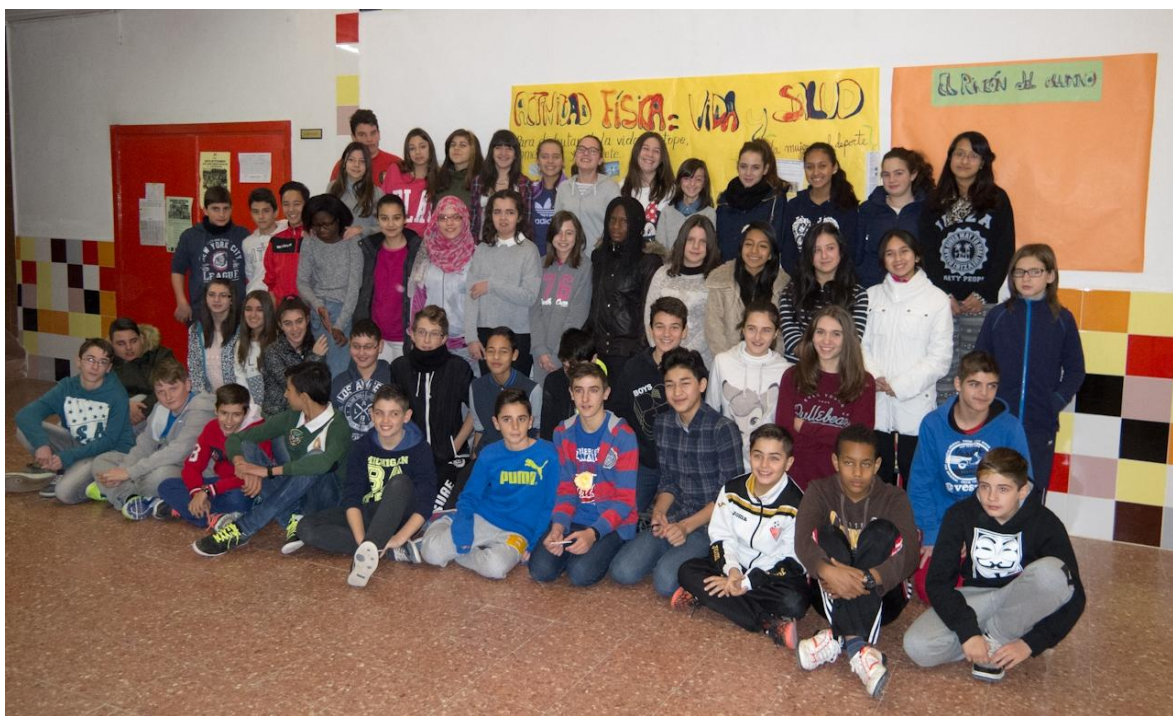
Alumnado de 1º y 2º de ESO i FPB