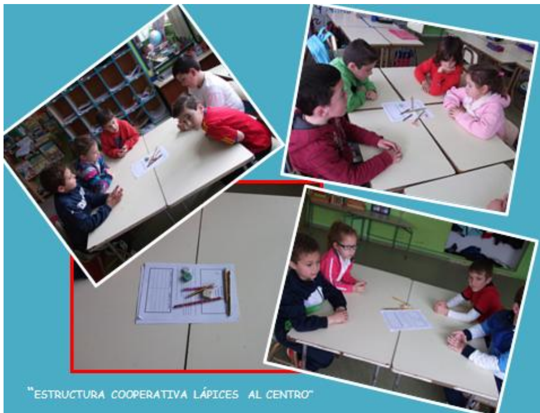
"ESTRUCTURA COOPERATIVA LÁPICES AL CENTRO"

Para concluir, en estos tres últimos cursos estamos inmersos en la formación en competencias emocionales (personales y sociales), tanto del alumnado como del profesorado. Siendo conscientes de los descubrimientos de la Neurociencia sobre el funcionamiento del cerebro y sus implicaciones educativas en lo que empieza a conocerse como Neuropsicopedagogía y Neuroeducación, y de las aportaciones de la Psicología a la Inteligencia Emocional y su desarrollo en los modelos de Educación Emocional, nos hemos propuesto conocer las variables que afectan a las relaciones de convivencia de toda la comunidad educativa.