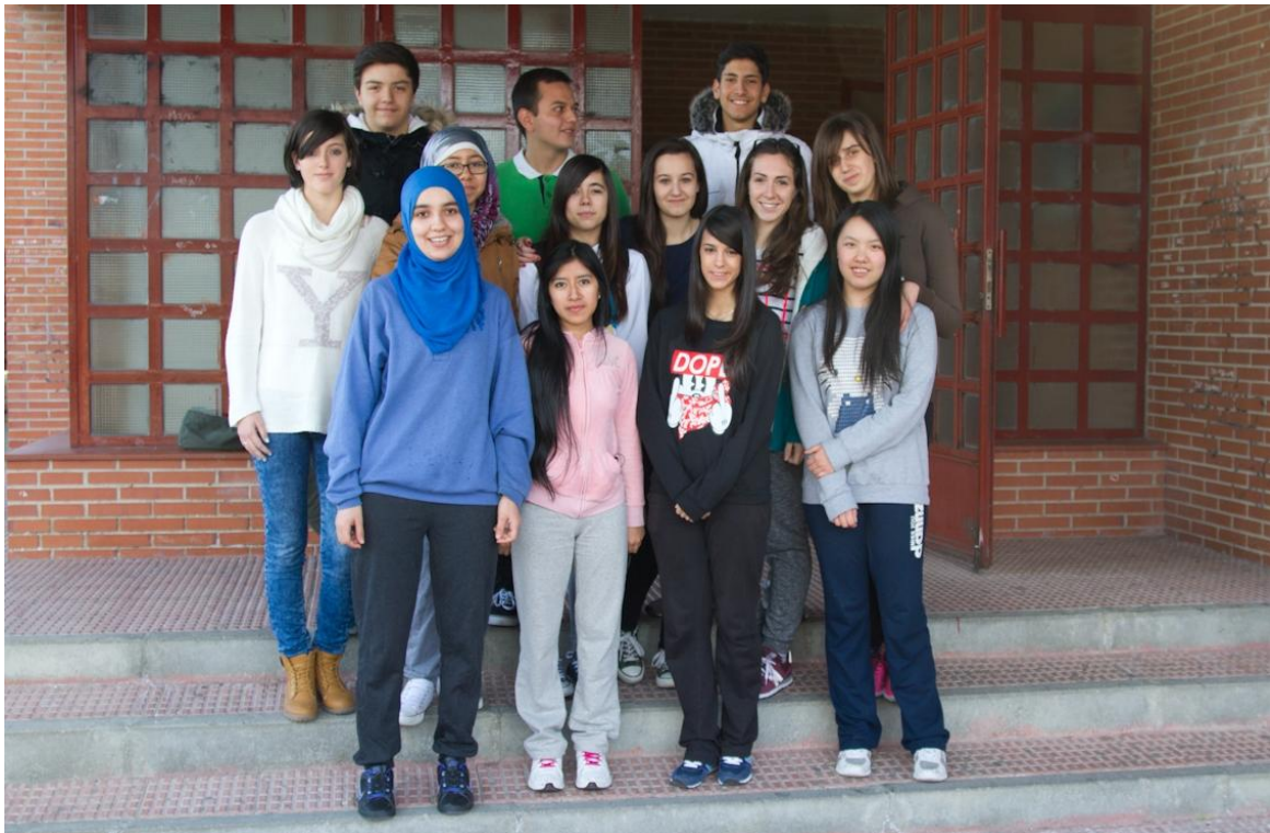
Alumnado de 1º de Bachillerato