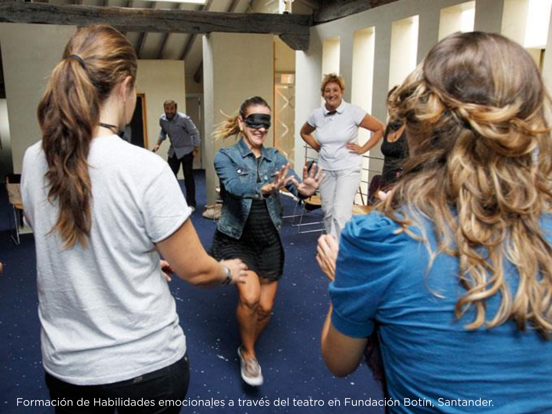
Formación de Habilidades emocionales a través del teatro en Fundación Botín, Santander.