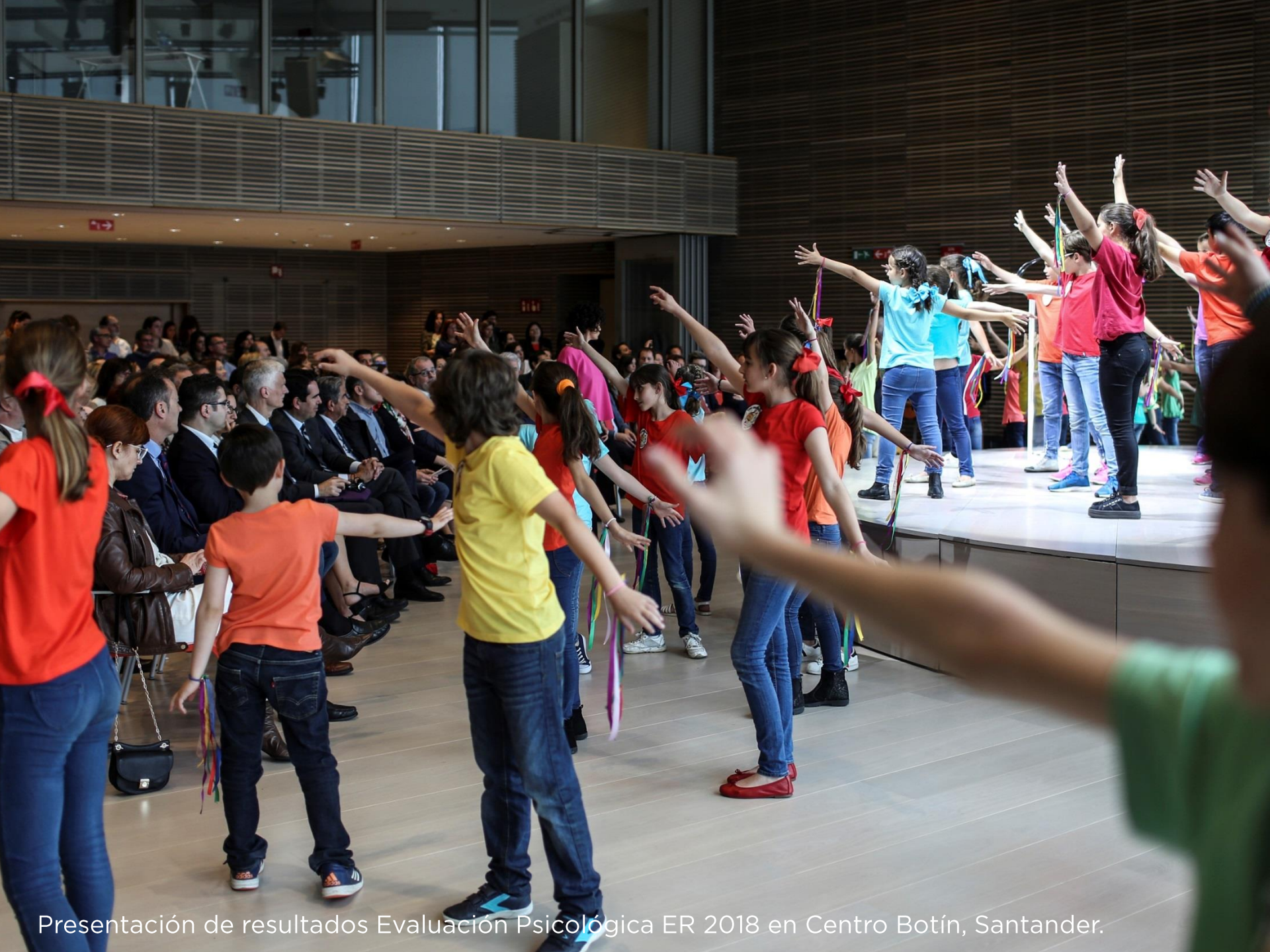
Presentación de resultados Evaluación Psicológica ER 2018 en Centro Botín, Santander.