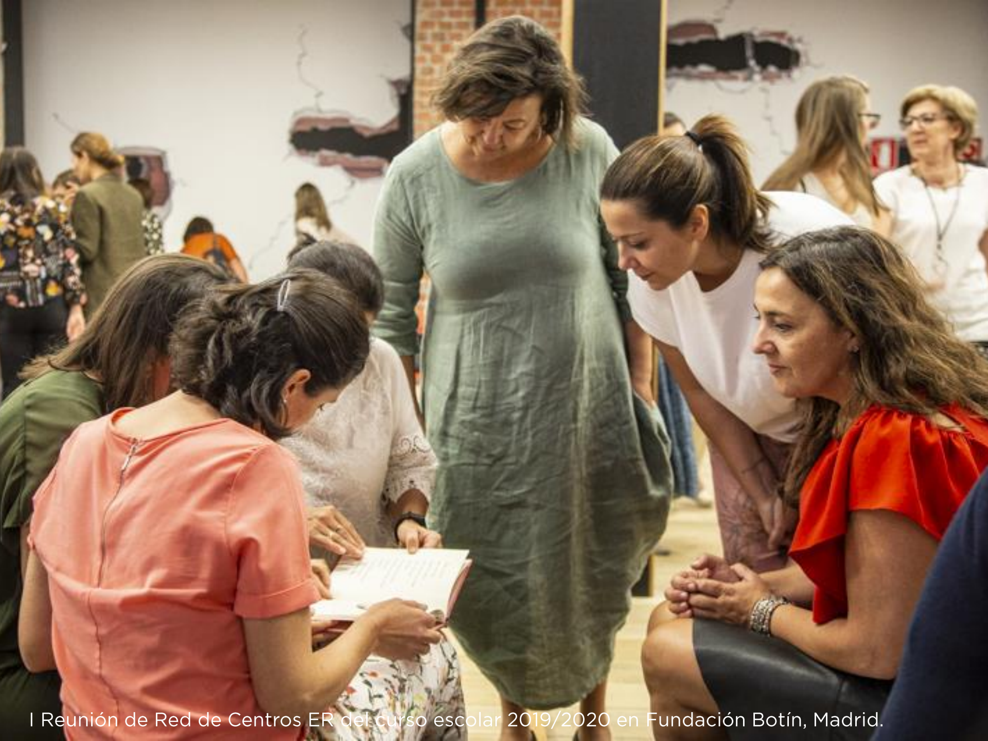
I Reunión de Red de Centros ER del curso escolar 2019/2020 en Fundación Botín, Madrid.