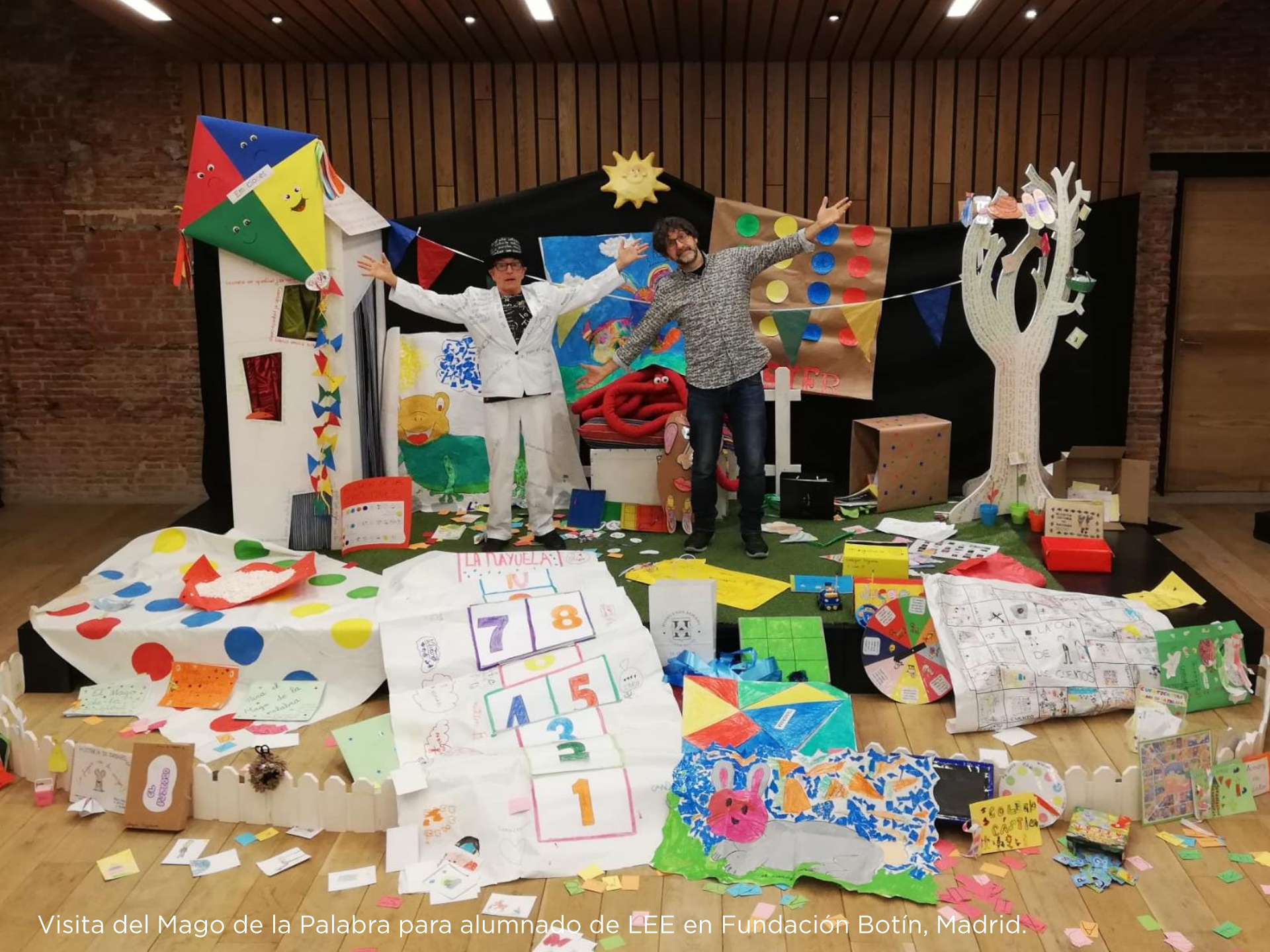
Visita del Mago de la Palabra para alumnado de LEE en Fundación Botín, Madrid.