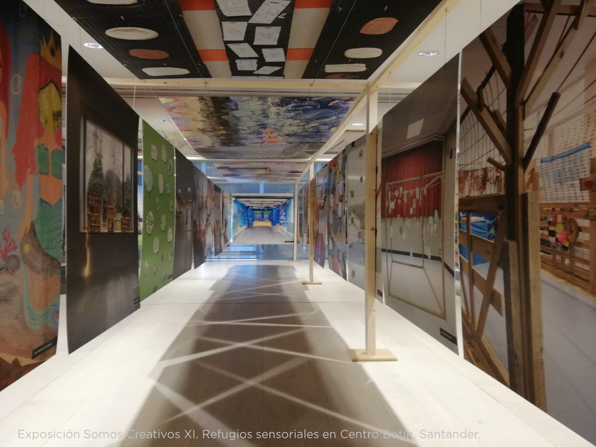
Exposición Somos Creativos XI. Refugios sensoriales en Centro Botín, Santander.