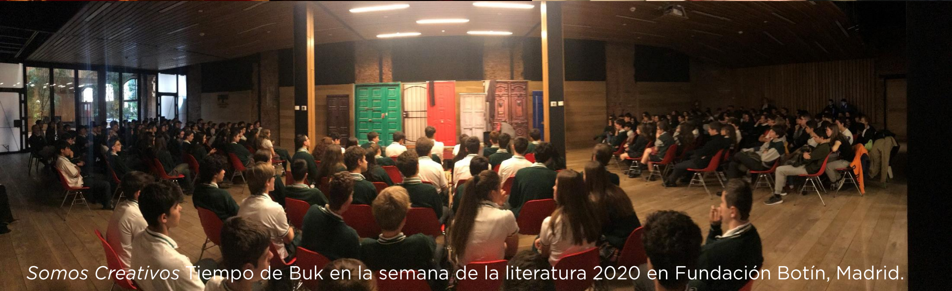
Somos Creativos Tiempo de Buk en la semana de la literatura 2020 en Fundación Botín, Madrid.