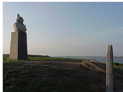
Monumento a Toro Sentado en Mobridge, Dakota del Sur.

El cuerpo de Toro Sentado fue enterrado en el cementerio del fuerte Yates. En 1953, un grupo de ciudadanos de Mobridge (Dakota del Sur), con el permiso de los descendientes de Toro Sentado y del gobierno, trasladaron los restos a una colina, donde se erigió un busto del jefe tribal cuyo autor fue Korczak Zoilkowski . Sin embargo, existe disputa de si los restos son verdaderos. 17 18 Por otra parte, en cuanto a la vida privada de Toro Sentado, se estima que desposó a cinco mujeres, con las que procreó doce hijos. 19