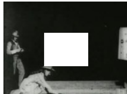
Película Annie Oakley o The Little Sure Shot of the Wild West (1894).