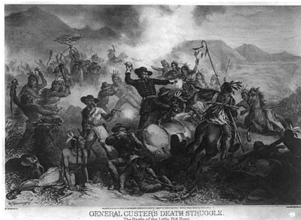
Interpretación de la batalla de Little Big Horn.

Aunque en el tratado de fort Laramie se garantizaba la protección del Estado sobre la propiedad de los nativos, 8 el descubrimiento de oro en Black Hills provocó la llegada de aventureros que invadían sus campos de caza. Para 1875, se estima que había mil colonos establecidos en el lugar, y cuando fallaron los intentos gubernamentales de comprar la zona —y en contra de lo establecido en el tratado— se dispuso que los nativos se asentaran en las reservas antes del 31 de enero de 1877. Los que no obedecieran dicha orden, se considerarían infractores de la ley. Ante la amenaza, algunos jefes tribales decidieron vender sus tierras, como lo hicieron aquellos que ya se habían asentado en las reservas como Spotted Tail y Nube Roja ; 3 Toro Sentado, por el contrario, decidió defender lo suyo. 2