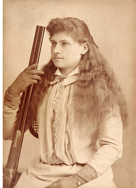
Oakley en la década de 1880