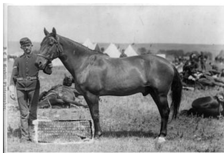
Comanche , el único caballo superviviente del destacamento de Custer.

nativos caían del cielo. Toro Sentado expresó que los soldados eran ofrenda de Wakan Tanka, por lo que exhortó a su gente a que los aniquilaran en la batalla. Sin embargo, les previno que no debían tomar sus armas, caballos, ni cualquier otro despojo, porque de lo contrario sería la perdición de los nativos. 3