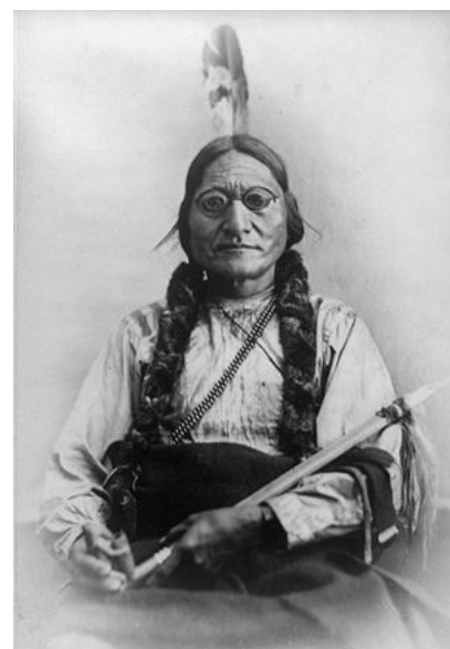
Toro Sentado en 1881.

Poco a poco, los jefes tribales comenzaban a rendirse —entre ellos Caballo Loco— y eran obligados a ceder sus tierras. Su situación se había agravado desde que el Congreso del país había decidido interrumpirles el abastecimiento de provisiones, con el objetivo de someterlos a las disposiciones gubernamentales. 9 Toro Sentado decidió resistir. En 1877, encabezó una marcha hacia el territorio de Canadá con unos mil seguidores, 12 fuera del alcance de las tropas y cuyo número ascendería a cinco mil en los meses siguientes con la llegada de otros refugiados. Para el mes de agosto, el general Alfred Terry se desplazó a Canadá para ofrecerle una amnistía a cambio de refugiarse en una reserva, pero Toro Sentado rechazó la propuesta. Por otra parte, los periódicos canadienses comenzaron a difundir noticias falsas de una supuesta confabulación de Toro Sentado con otras tribus locales, para organizar un ataque en los Estados Unidos y generar otros disturbios. 12