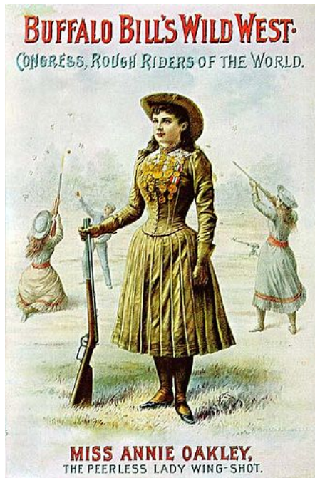
Cartel anunciando a Annie Oakley en el espectáculo de Buffalo Bill

(minuto 0:34:55), James "Big Jim" Rinnie le dice a Julia Shumway (ambos protagonistas) "-Tranquila Annie Oakley-" haciéndole burla cuando este la intercepta por sorpresa -mientras ella mira distraída el lago- reaccionando ella bruscamente con arma en mano.