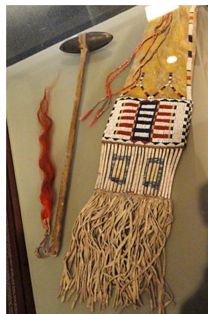
Objetos pertenecientes a Toro Sentado.

Entre los años 1863 y 1868, el ejército estadounidense realizaba incursiones en los campos de caza del territorio de los lakota, lo que provocaba continuos conflictos. De hecho, a raíz de una rebelión de la tribu siux santee en Minnesota, se realizó una intensa campaña militar en la que Toro Sentado tuvo su primera batalla contra las tropas gubernamentales en junio de 1863. En 1864, volvió a pelear en la batalla de la montaña Killdeer, y también dio albergue a los sobrevivientes de la masacre de Sand Creek en el Territorio de Colorado, que había sido ejecutada por los militares en detrimento de las tribus cheyenne y arapajó . 3 4 Ese mismo año, la señorita Fanny Kelly cayó como rehén de los siux por cinco meses, y pudo conocer a Toro Sentado. Ella daría testimonio de la hospitalidad del jefe tribal con estas palabras: «Era cortés y afectuoso con su esposa e hijos, y se comportaba de igual manera con los forasteros. En el tiempo que pasé con ellos, la comida escaseaba, y tanto Toro Sentado como su esposa preferían pasar