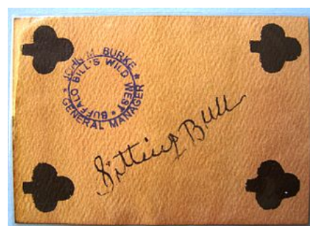
Carta de baraja que solían firmar los personajes famosos (Toro Sentado en este caso) que actuaban en el Buffalo Bill's Wild West Show.

En 1885, Toro Sentado obtuvo el permiso para acompañar el show de Buffalo Bill que recreaba las gestas del Viejo Oeste . Con esta compañía logró viajar a través de los Estados Unidos, Canadá y Europa, y ganaba cincuenta dólares semanales por montar a caballo; 5 aparte de que se hacía de algún dinero por firmar autógrafos. Sin embargo, se mantuvo en el espectáculo apenas cuatro meses. Se dice que no soportaba la sociedad «civilizada» del hombre de piel blanca, principalmente cuando observaba el sinnúmero de pordioseros que vivían en las calles, a quienes él mismo daba limosna. Además, recibía una que otra ofensa por parte del público que no olvidaba lo ocurrido en Little Big Horn. 13 Pese a todo, en ese tiempo logró entrevistarse con el presidente Grover Cleveland . 14