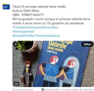
Ejemplo Twitter (borrador hecho en el twitter del cole sin publicar)