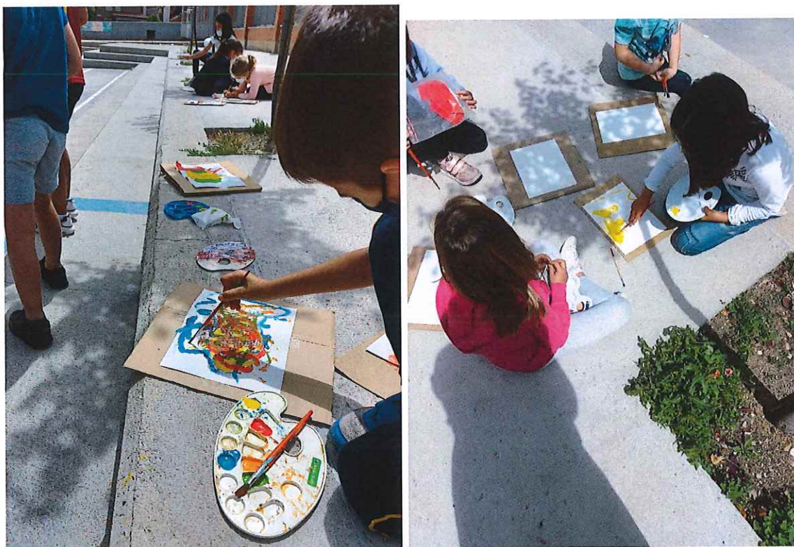
Komorebi. Pintamos la luz entre las hojas de los árboles y su sombra.

En la mayoría de las realizaciones, nos inspiramos en grandes creadoras y creadores de la Historia del arte.