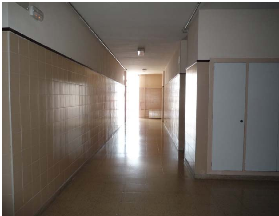
12. VISTA DE UNO DE LOS CORREDORES INTERIORES DEL EDIFICIO "A": al fondo el hueco del muro cortina a través del que se establecerá, tras su adecuación, la salida hacia el Pabellón de la escalera de emergencia.