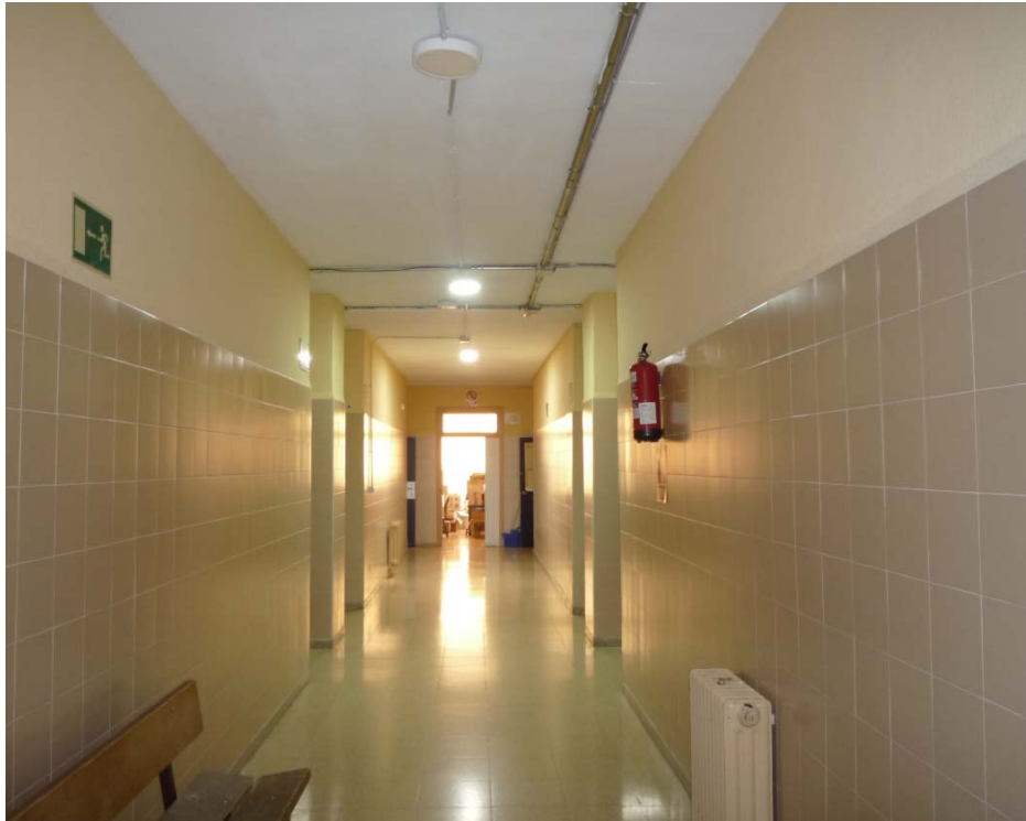
11. VISTA DE UNO DE LOS CORREDORES INTERIORES DEL EDIFICIO "B": al fondo el local de almacén a través del que se establecerá, tras su adecuación, la salida hacia el Pabellón de la escalera de emergencia.