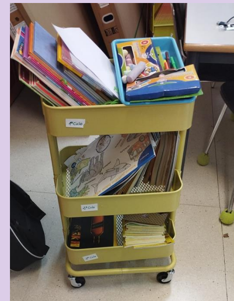
CARRITO MÓVIL DE MATERIALES DE LOS RC