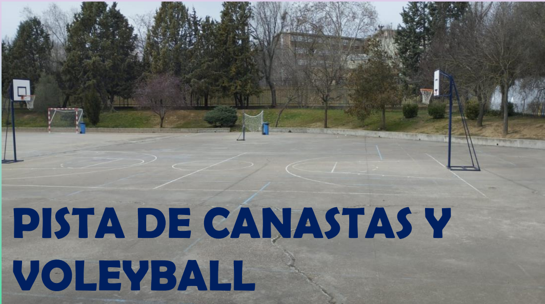
PISTA DE CANASTAS Y VOLEYBALL