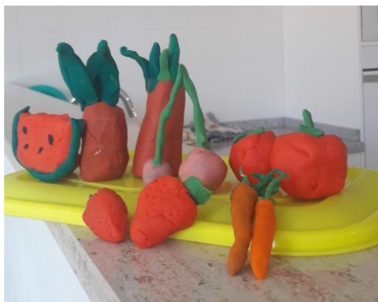
Bodegón de alimentos de la primavera hechos en plastilina.