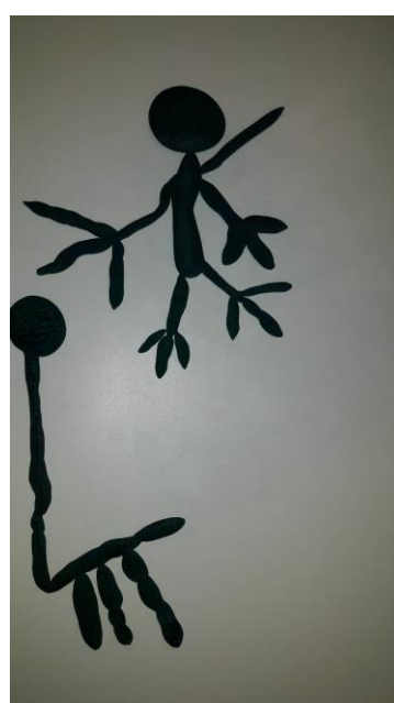
Figuras de plastilina realizadas por uno de los alumnos: animales y personas