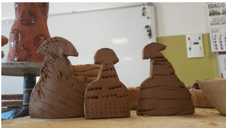
Las meninas, planas. Arcilla