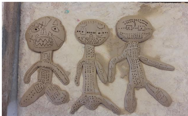
Mis compañeros. Arcilla