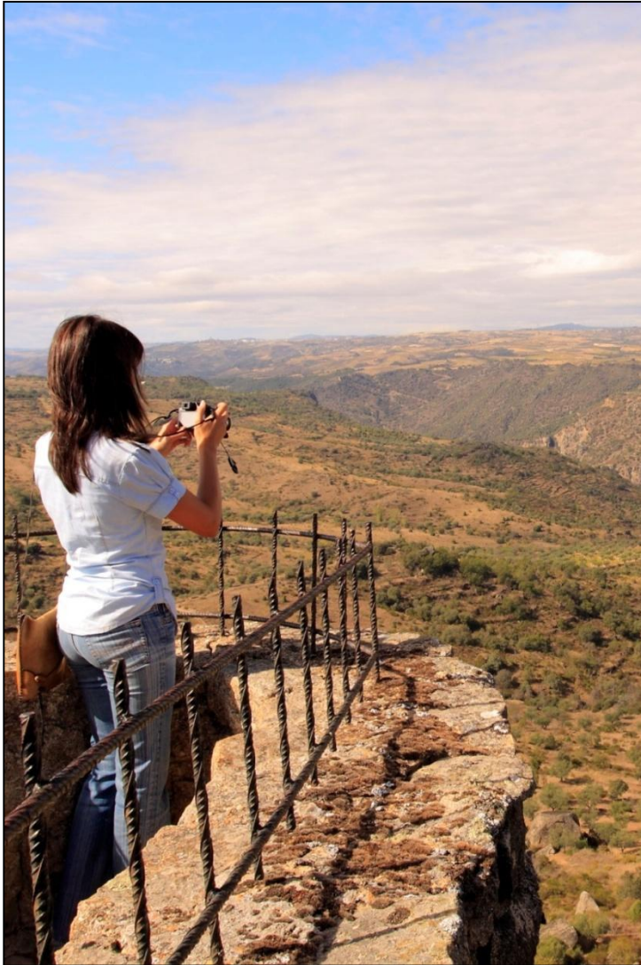
Las vistas del territorio del Parque Natural Arribes de Duero desde el alto de Fermoselle animan a la práctica de la fotografía de paisajes.