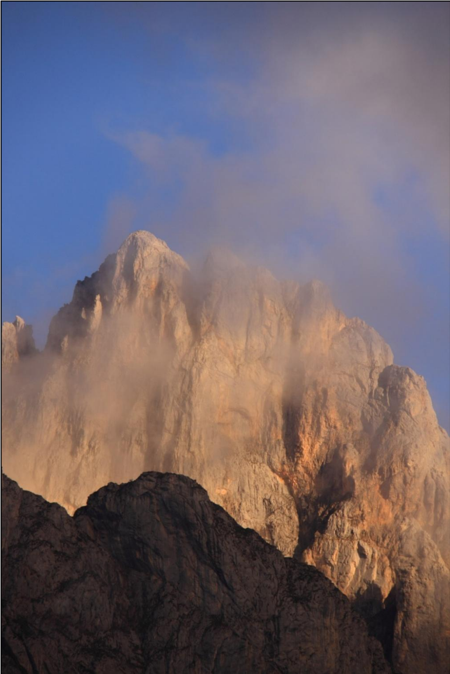
Espectaculares paisajes en el Parque Nacional de los Picos de Europa. Vertiente leonesa.