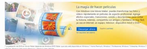
Windows Live Movie Maker 2011

También se puede descargar desde el siguiente sitio web: http://download.live.com/moviemaker