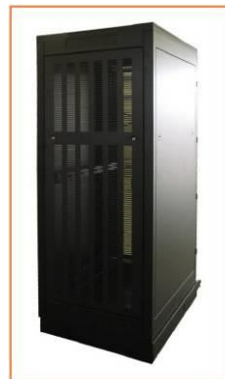
Armario Rack 45 U 800x1000