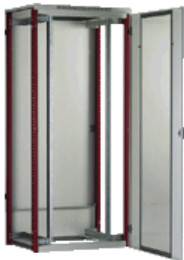
Armario Rack 45U 800x800

Techo, parte trasera y laterales en chapa de acero, desmontables y con rejillas de ventilación, puerta frontal metálica microperforada provistas de junta de goma y llave