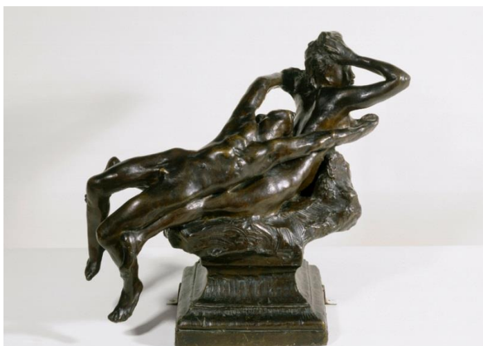
Auguste Rodin. Fugit Amor , 1866. Bronce. Museo d'Orsay, París