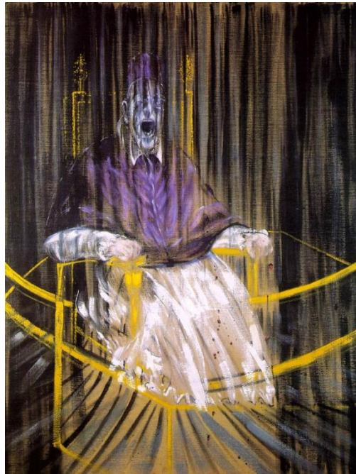
Francis Bacon. Retrato del Papa Inocencio X . 1953, Óleo. Des Moines Art Center, Iowa. Estados Unidos.