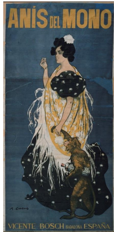
Ramón Casas. Cartel de Anís del Mono (mono y mona) .1898, Cartel. Museo Nacional de Arte de Cataluña, Barcelona.

Junta de Castilla y León Consejería de Educación