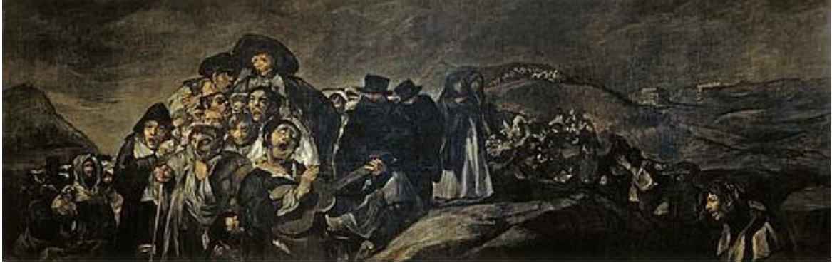
Francisco de Goya. La Romería de San Isidro , 1820-1823. Pintura mural al óleo trasladada al lienzo. Museo del Prado, Madrid

DESARROLLO DEL TEMA: Apoyándose en las imágenes y textos presentados redacte un único texto sobre La luz en las distintas manifestaciones artísticas