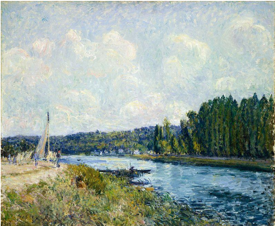
Alfred Sisley, Les berges de l'Oise . 1877-1878. National Gallery of Art, Washington, EEUU