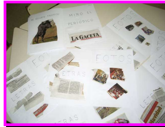
El fruto de nuestro trabajo