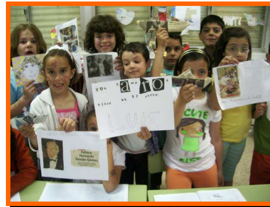
Trabajamos en grupo