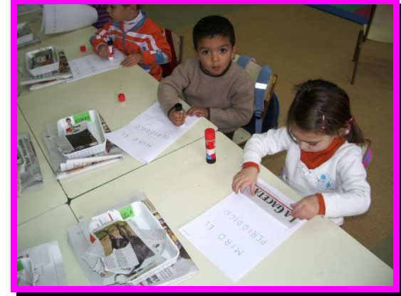
Recortamos y pegamos...