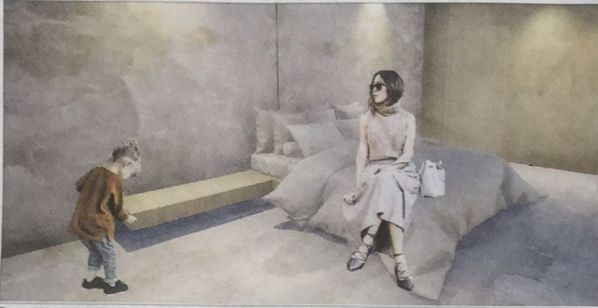
Recreación de la habitación del hotel, con dos huéspedes.