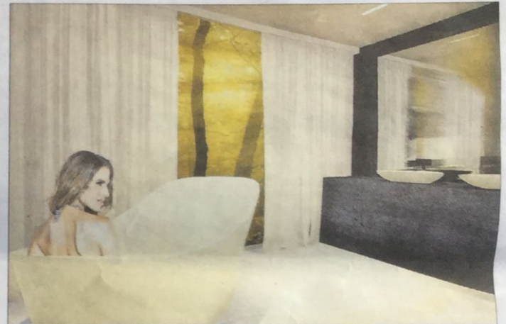
Ilustración del aseo, con una gran bañera en el centro y vista al exterior.