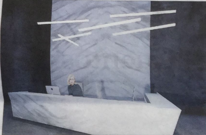
Visión general de la recepción del hotel ideada por la estudiante.