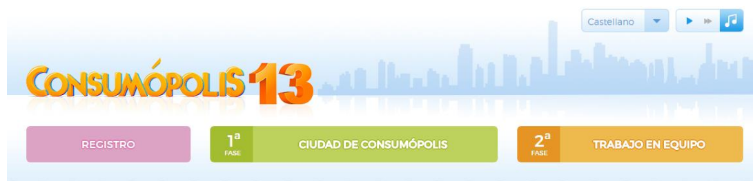
Ilustración 2. Captura de pantalla de la selección de los diferentes idiomas que tiene la plataforma.

La página de la ciudad de Consumópolis se abre en la lengua que ha elegido previamente en el portal. Si no se ha seleccionado ningún idioma, por defecto, se abre en castellano. En el caso de que quiera cambiar el idioma en la ciudad de Consumópolis , también puede hacerlo haciendo clic en el desplegable.