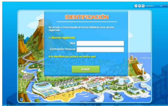
Ilustración 5. Captura de pantalla del acceso e identificación de la plataforma

Se accede a la ciudad virtual de Consumópolis de forma individual, como persona concursante registrada.