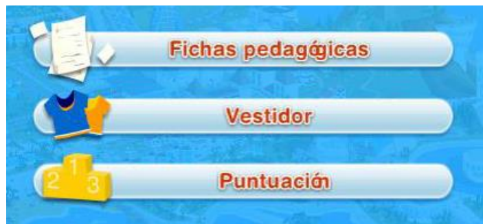
Ilustración 6. Captura de pantalla de las herramientas de las que dispone la persona usuaria

Para facilitar el desarrollo del concurso, las personas participantes disponen de las siguientes herramientas: