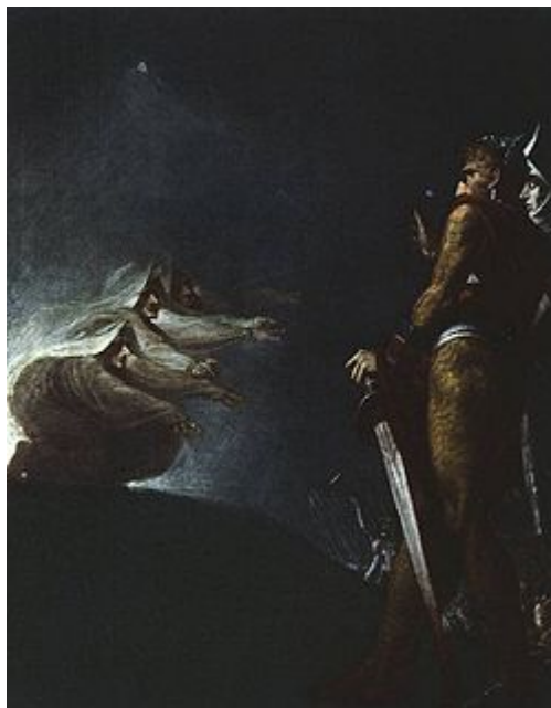
Macbeth y Banquo con las Brujas por Johann Heinrich Füssli .

La obra comienza con tres brujas , las tres "Hermanas Fatídicas", que se ponen de acuerdo acerca de su próximo encuentro con Macbeth. En la escena siguiente, Duncan, rey de Escocia, comenta con sus oficiales el aplastamiento de la invasión de Escocia por noruegos e irlandeses , acaudillados por el rebelde Macdonwald, en la cual Macbeth, thane (barón) de Glamis y primo del rey, ha tenido un importante papel. Duncan se propone darle en recompensa el título de thane de Cawdor.