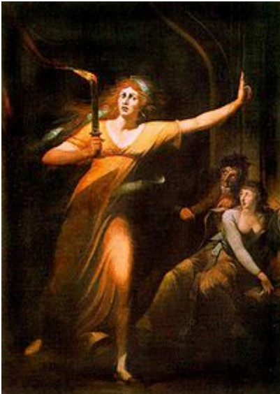
Lady Macbeth sonámbula por Johann Heinrich Füssli .

Lady Macbeth empieza a sufrir remordimientos: sonámbula, intenta lavar manchas de sangre imaginarias de sus manos.