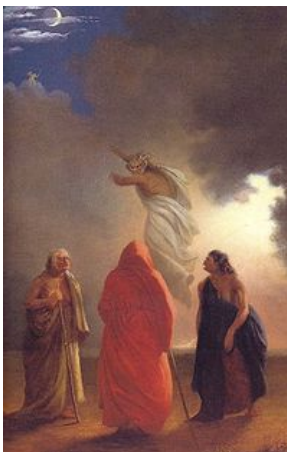
Escena de Macbeth . el conjuro de las brujas (acto IV, escena I). Cuadro de William Rimmer .