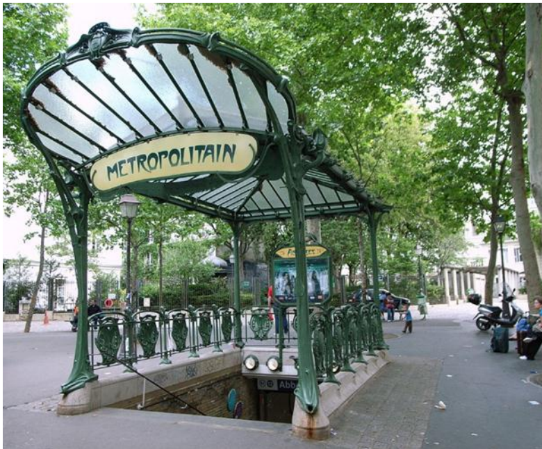
Marquesina. Entrada a la estación de metro Abbesses en París, Hector Guimard.1900.

“amo la arquitectura porque es esencia, estructura, función, contiene en sí misma todas las demás artes, sin excepción” H. Guimard