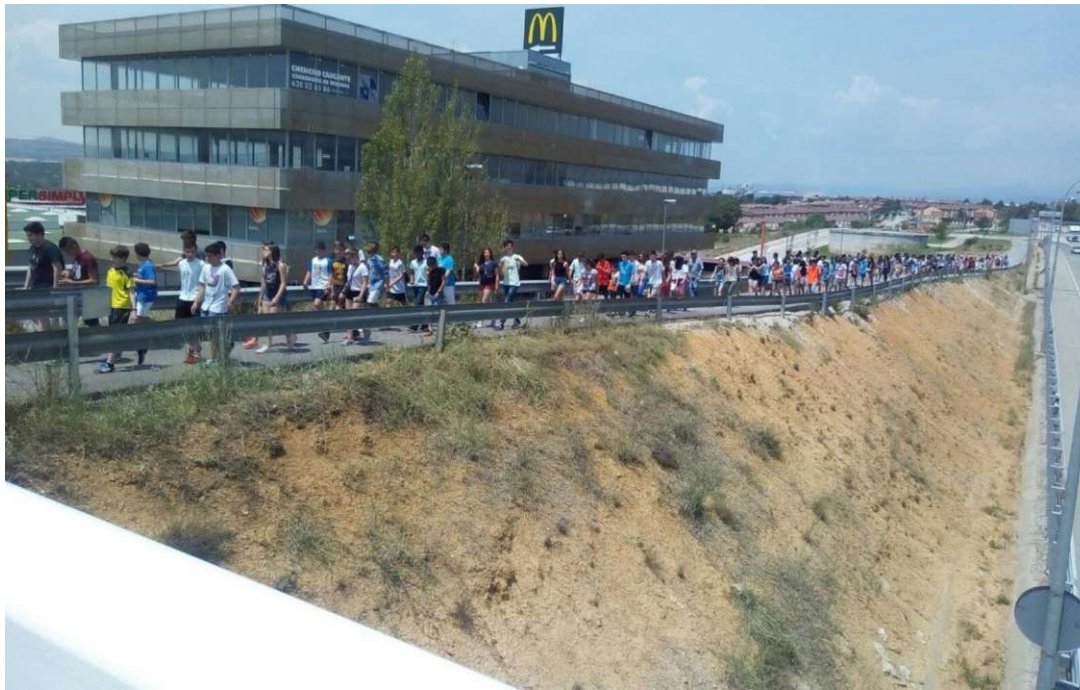
Jornadas de Convivencia