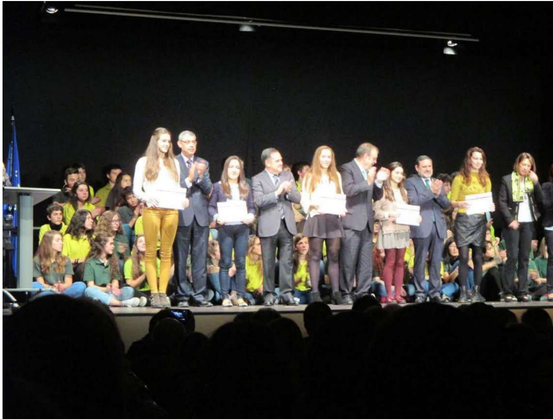
Premio al Rendimiento Escolar. 4° ESO (Curso 2015/16)