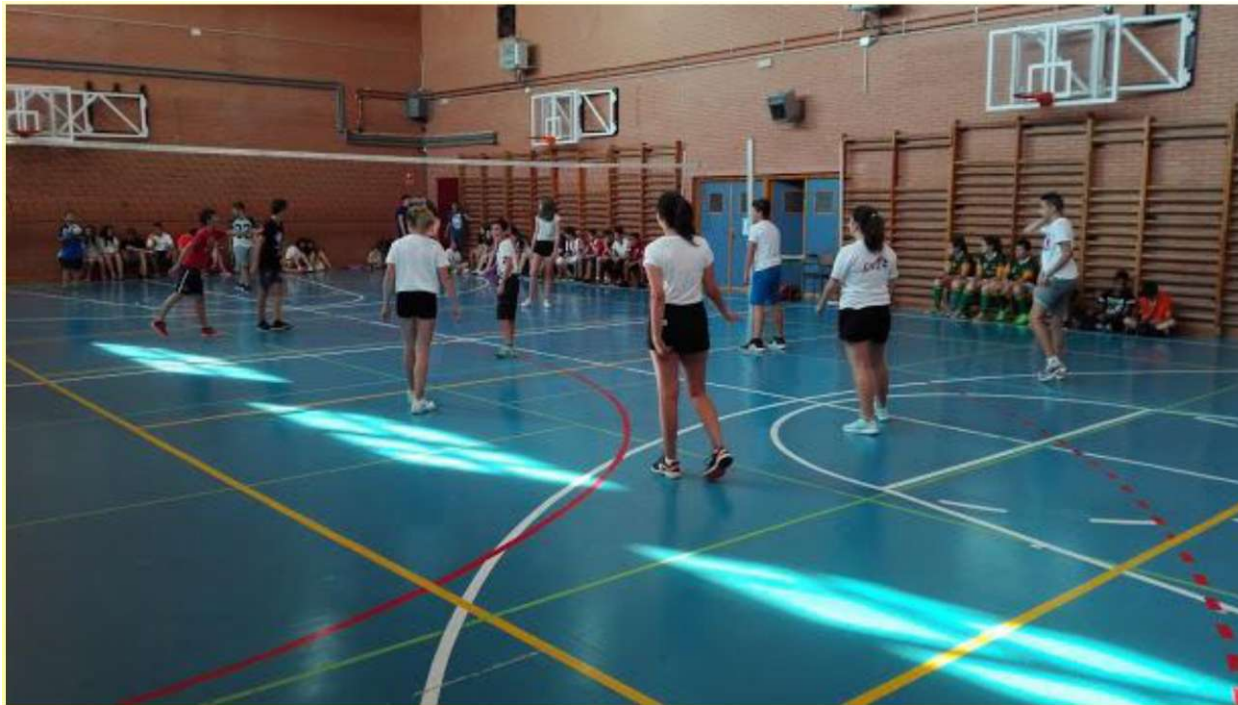
Jornadas de Convivencia