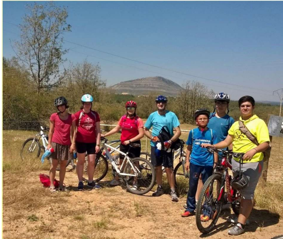
Jornadas de Convivencia