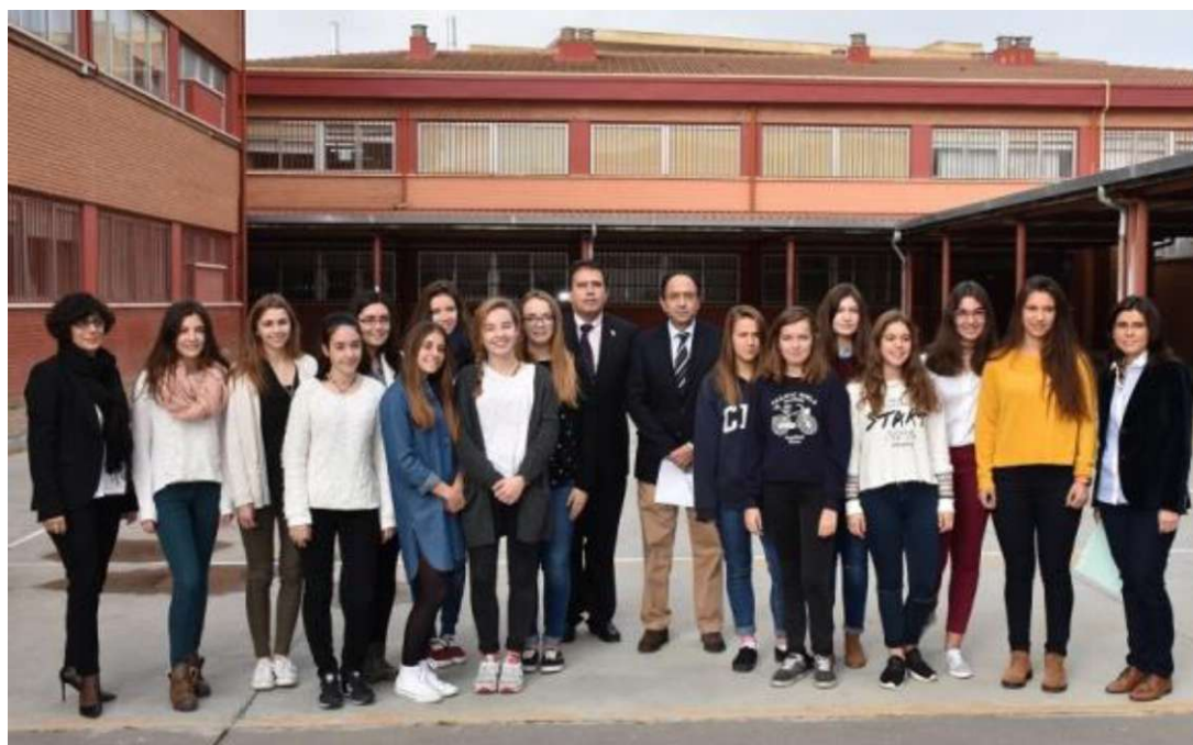
Intercambio con L' Académie de Grenoble