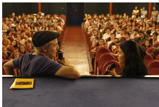
Fotografías de la sesiones presenciales en el Cine Doré y las sesiones en modalidad virtual.