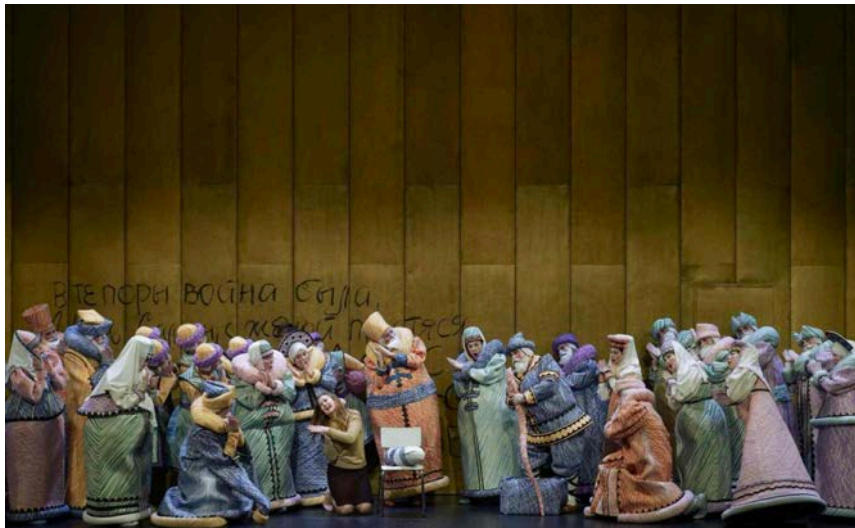
El Coro Titular del Teatro Real en El cuento del zar Saltán