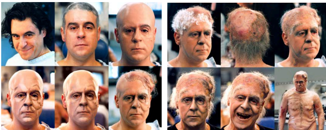
Proceso de caracterización del barítono Carlos Álvarez para la ópera Rigoletto