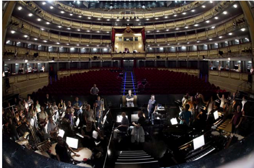
La Orquesta Titular del Teatro Real en el foso